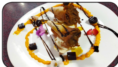
AMOUR POUR LA CUISINE

HORARIO DEGUSTACIÓN DE LA TAPA De Lunes a Domingo de 21:00 a 00:00 h.