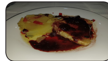
TACO DE LOMO CON PAPAS A LO POBRE Y FRUTOS ROJOS

HORARIO DEGUSTACIÓN DE LA TAPA De Martes a Domingo de 21:30 a 00:00 h.