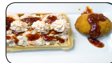
GOFRE SALADO Y ARANCINI SORPRESA

HORARIO DEGUSTACIÓN DE LA TAPA De Jueves a Domingo de 21:00 a 00:00 h.