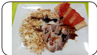
EL LAGARTO DE JAÉN

HORARIO DEGUSTACIÓN DE LA TAPA De Martes a Domingo de 21:00 a 00:00 h.