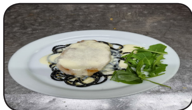
SOLOMILLO DE CABRALES CON FONDO DE ESPAGUETI DE SEPIA

HORARIO DEGUSTACIÓN DE LA TAPA De Lunes a Domingo de 21:00 a 00:00 h.